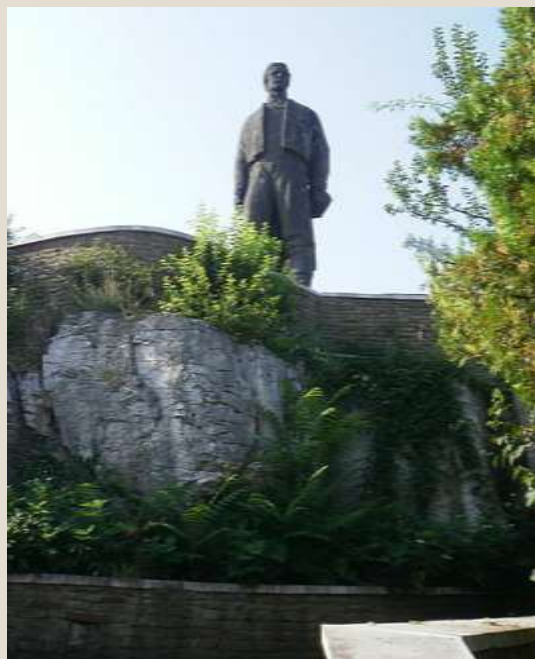
Паметник на Васил Левски в Ловеч