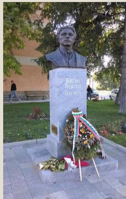
Паметник на Васил Левски в Цариброд