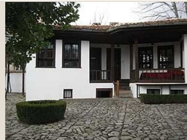
Национален музей „Васил Левски“