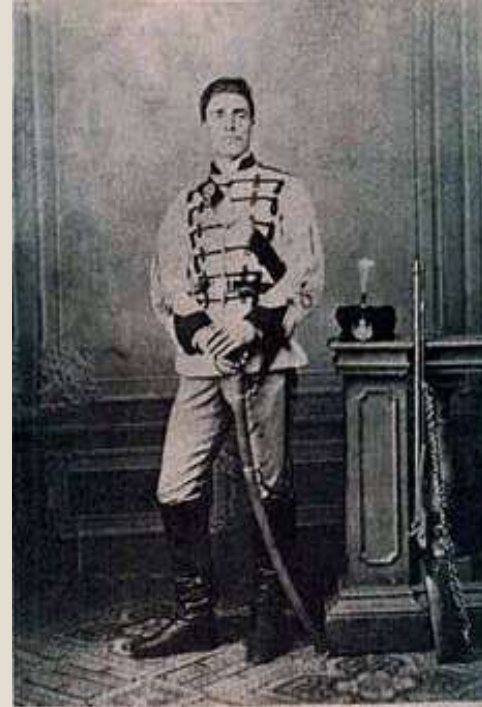
Васил Левски в униформа на Първата българска легия в Букурещ