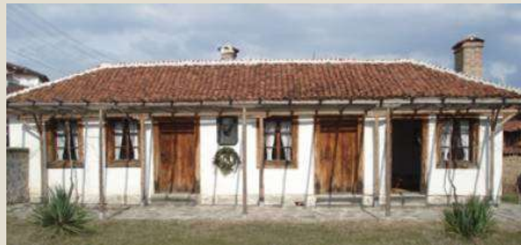
Килийното училище в Карлово