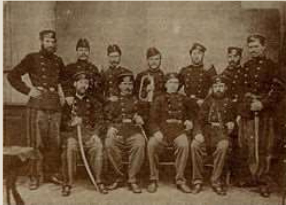
Васил Левски сред другари от Втората българска легия в Белград