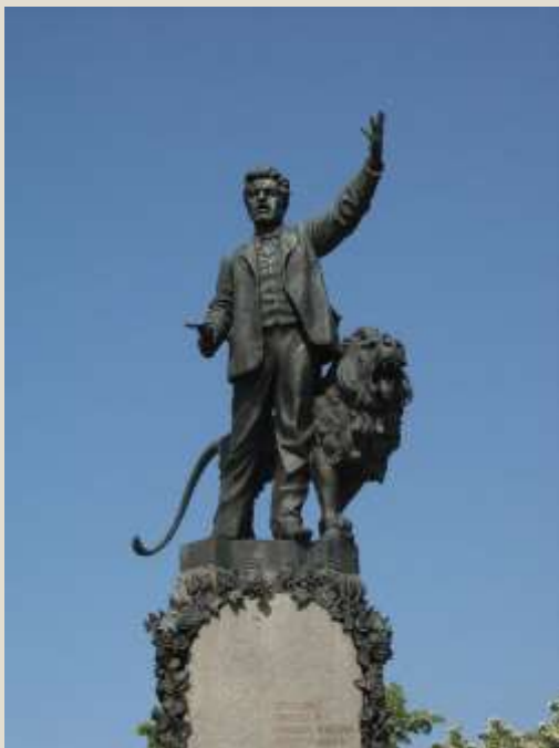
Паметник на Васил Левски в Карлово