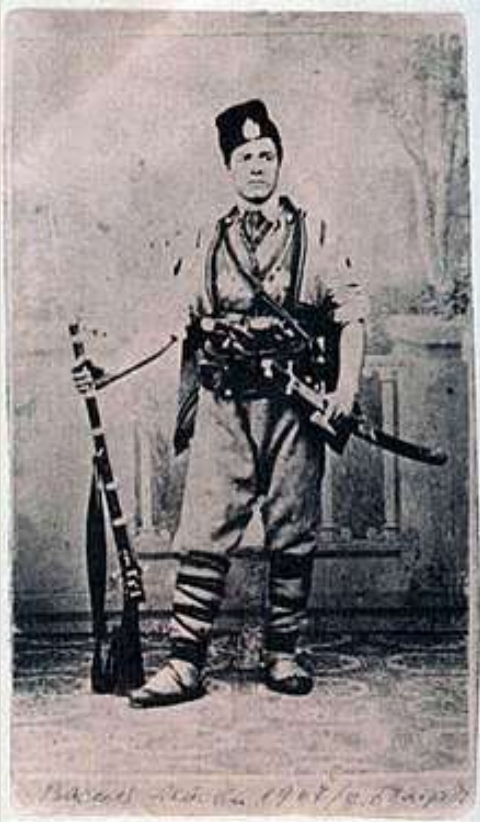
Васил Левски като знаменосец на четата на Панайот Хитов