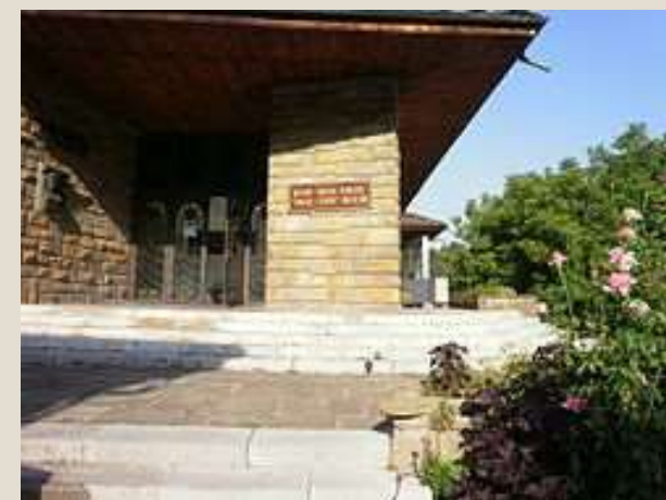
Музей „Васил Левски“ (Ловеч)