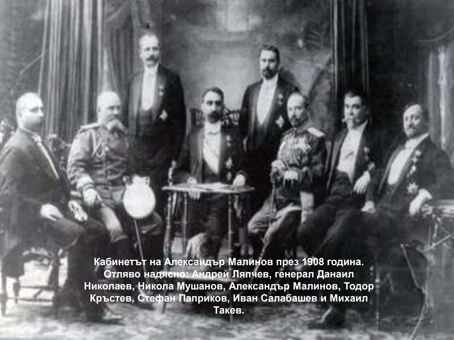
Кабинетът на Александър Малинов през 1908 година. Отляво надясно: Андрей Ляпчев, генерал Данаил Николаев, Никола Мушанов, Александър Малинов, Тодор Кръстев, Стефан Паприков, Иван Салабашев и Михаил Такев.