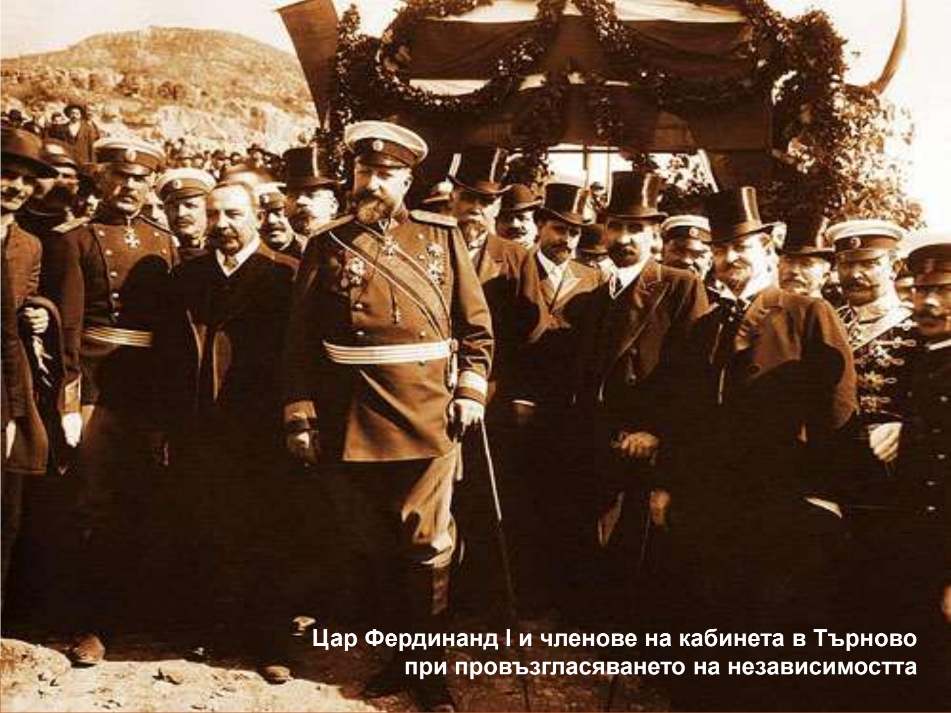
Цар Фердинанд I и членове на кабинета в Търново при провъзгласяването на независимостта